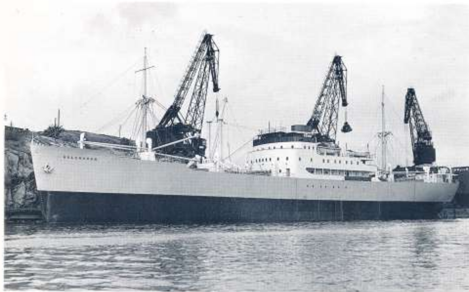
Efter leveransen lades KOLSNAREN upp i Sannegårdshamnen.

4-cylindriga dieselmotorer om 200 EHK, direkt kopplade till en 132 KW generator.