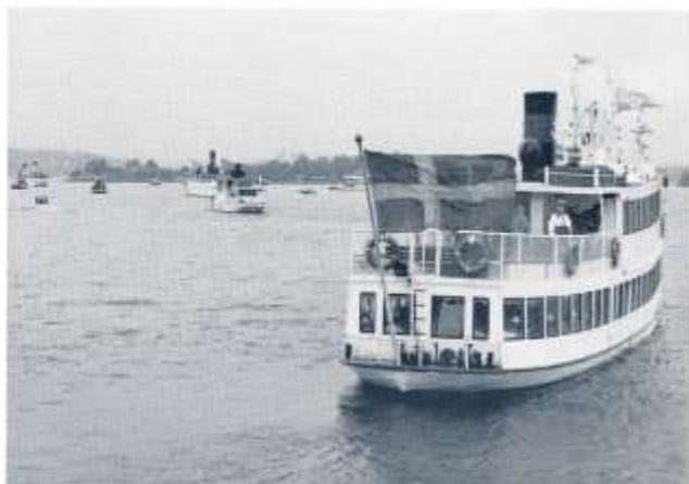
Drottningholmsträdens stolthet s/s DROTTNINGHOLM den 18/7 1992. Lars-Olof tog bilden från BOHUSLÄN. Längre bort skymtar s/s EJDERN. Längre bort s/s BJÖRKFJÄRDEN. I babordskanten s/s BLIDÖSUND.