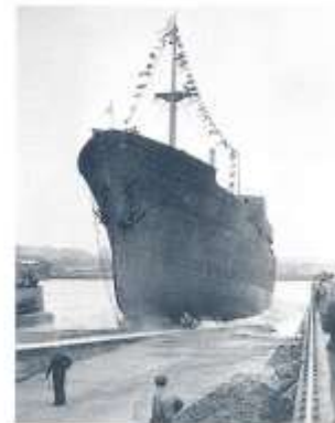
Nybygge 331 glider ned i sitt rätta element.

"Ditt namn skall vara KOLSNAREN. Må välgång..." När champagneflaskan krossats mot stöven började KOLSNAREN sakta glida ner i Göta Alvs kyliga vatten, där Röda Bolagets bogserare väntade på att få ta hand om skrovet.