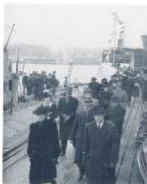
Personal från Transatlantic var inbjuden till sjösättningen.