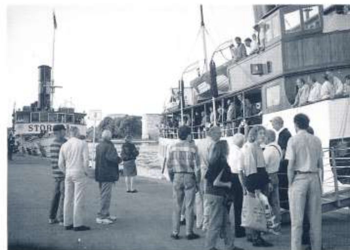
Från utfärden i Stock- holm skärgård med ång- fartygen, s/s STORSKÄR och s/s BOHUSLAN vid ångbåtskajen i Waxholm. Passagerarbeläggningen som synes god. Foto den 20/7 1992 av Lars-Olof Hansson.