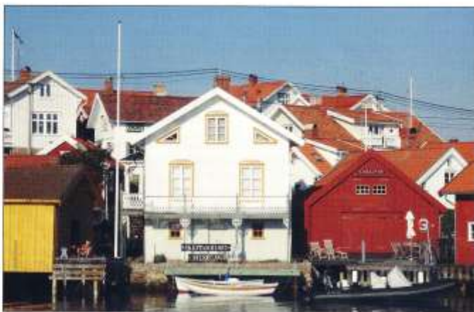
Med gaveln mot hamnen ligger Skepparhuset på Gullholmen. Sedan 1988 är det museum som visar hur en kutterseppare levde för 100 år sedan.

Under första världskriget låg makrillfisket nere och 1920 infördes spritförbud i USA. Det blev omöjligt att sälja makrill dit. För kutterarna återstod fraktfarten som man även tidigare ägnat sig åt mellan fiskesåsongerna. Därmed satte man in motorer i kutterarna.