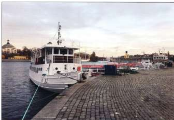
Systerbåtarna VESTA och DISA ses här som REX AV STOCKHOLM och RIDDARFJÄRDEN (längsidan syns) vid Skeppsbron i Stockholm. 27 oktober 2016

HAVSÖRNEN som är byggd 1965 var Waxholmsbolagets första snabbbåt och presterade på den tiden imponerande 26 knops fart. Numera uppges farten till 23 knop med tre Scania-motorer på totalt 1120 hk. Den såldes 2000 och tillhör nuvarande rederi sedan 2008.