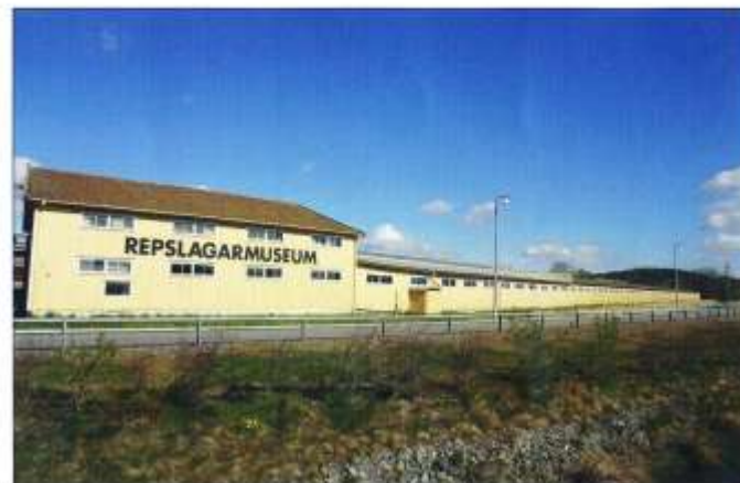
Repslagarmuseet i Älvängen med huvudbyggnad och den långa repslagarbanan.

Repslagarmuseet är ett arbetslivsmuseum som visar traditionell framställning av rep eller tågvirke med naturfibrer från hampa. Under segelfartygens tidsålder gick det åt stora mängder